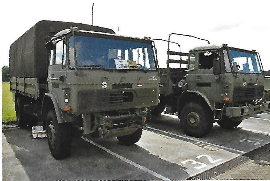
Het project Ivoria voorziet erin dat meerdere voertuigen onderdelen leveren om er een rijdend te houden.

Inmiddels leven we in een andere tijd. Er zijn diverse besluiten en maatregelen genomen die het CLAS moeten gaan versterken. Hieronder