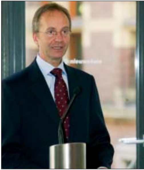
Minister Kamp: "De vrije meningsuiting mag echter geen vrijbrief worden om te kwetsen."