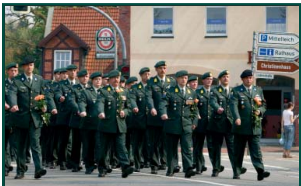
Het defilé van Nederlandse troepen door Zeven was indrukwekkend en trok zeer veel belangstellenden.