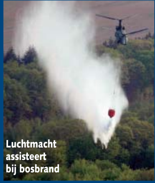
Luchtmacht assisteert bij bosbrand

APELDOORN - Een Chinook van de Koninklijke Luchtmacht heeft zaterdag in de namiddag en avond bijstand verleend bij een bos- en heidebrand in de buurt van Apeldoorn. De brandweer kreeg het vuur, dat werd aangewakkerd door de stevige wind, niet in de greep. De heli voerde tien runs uit. Foto: ANP ●