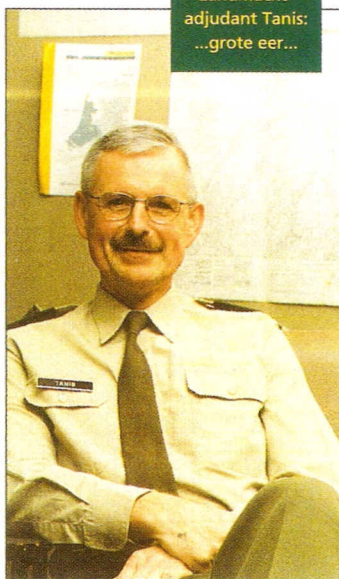
Landmacht- adjutant Tanis: ...grote eer...

Een gelegenheid die hij, naar het lijkt, ongewild voor een groot deel aan zijn eigen optreden in de toenmalige Raad van Advies Onderofficiersopleidingen te danken heeft gehad.